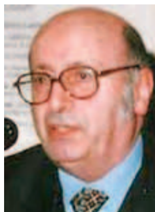
Il prof. Giovanni Reale

(p.l.r.) - Il prof. Giovanni Reale sarà insignito della cittadinanza onoraria del Comune di Casale Monferrato. La delibera è stata approvata in consiglio comunale. Reale ha frequentato il Ginnasio e il Liceo Classico a Casale Monferrato per poi formarsi presso l'Università Cattolica del Sacro Cuore di Milano, dove si è laureato con Francesco Olgiati. Ha perfezionato i suoi studi a Marburg an der Lahn e a Monaco di Baviera. Dopo un periodo di insegnamento nei licei, ha vinto una cattedra all'Università di Parma, ove ha tenuto i corsi di «Filosofia morale» e di «Storia della Filosofia». Poi è passato all'Università Cattolica di Milano, dove è stato a lungo ordinario di «Storia della Filosofia Antica» e dove ha anche fondato il