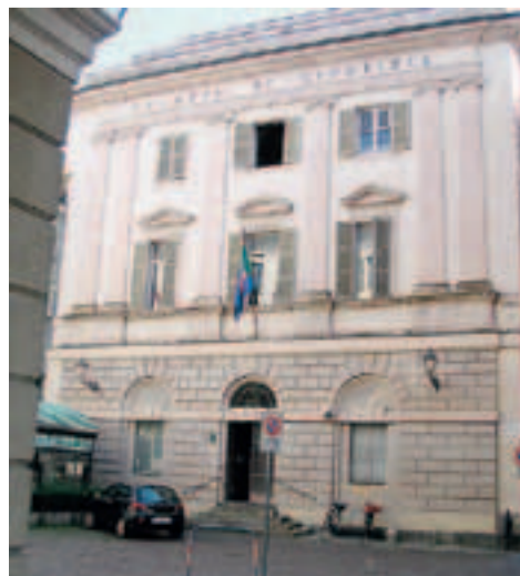
Il Tribunale di Casale Monferrato