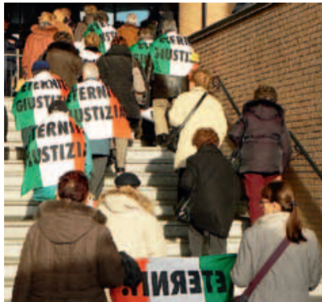
Bonifica, ricerca e giustizia restano le tre parole chiave della lotta alla fibra killer

LA DISCARICA Come finanziarla? Uno degli argomenti concreti emersi a Venezia