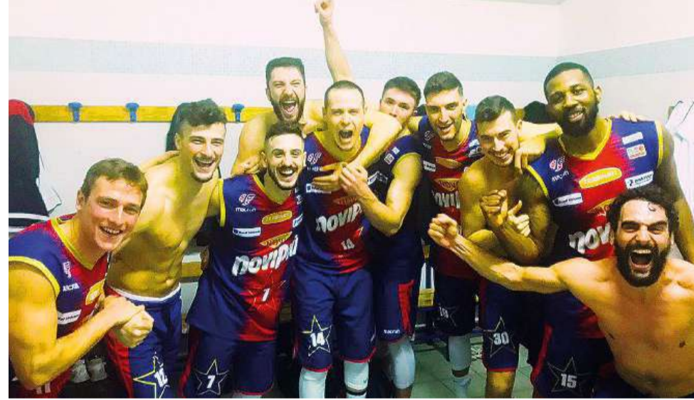
L'esultanza dei giocatori della Novipiù negli spogliatoi dopo la vittoria con Agrigento